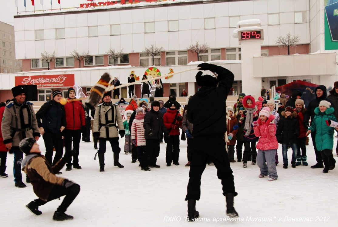
ЛХКО "В честь архангела Михаила", г.Лангепас 2017