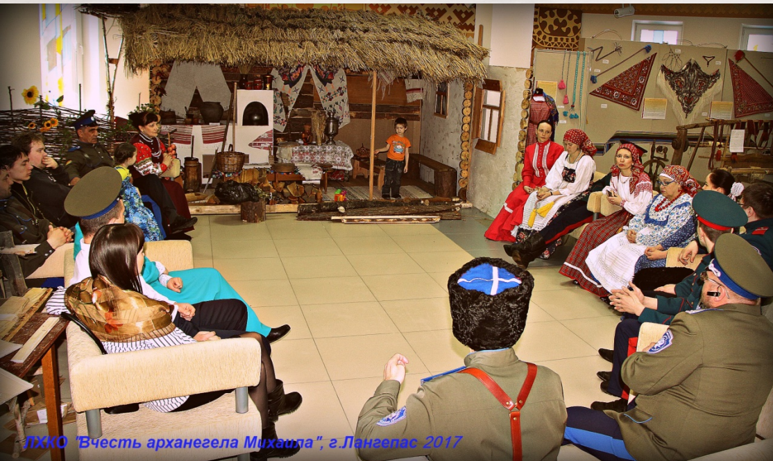
ЛХКО "В честь архангела Михаила", г.Лангепас 2017