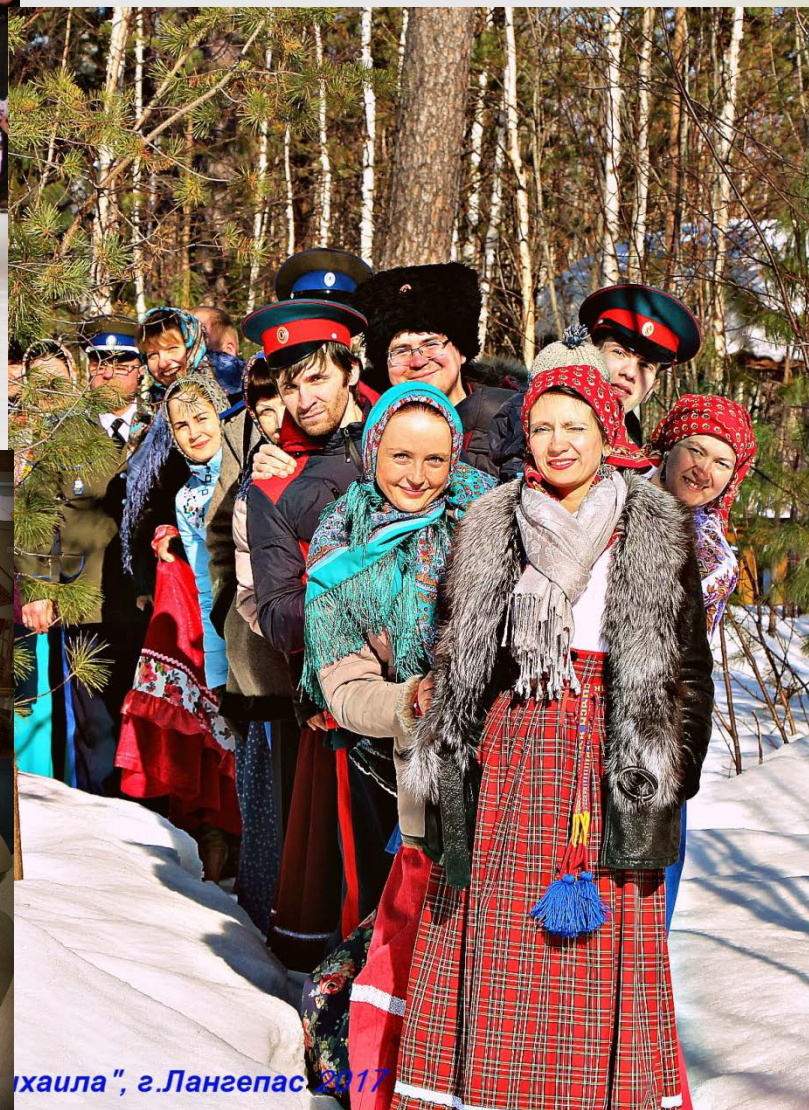
"В честь архангела Михаила", г.Лангепас 2017